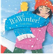
It's Winter! by Linda Glaser