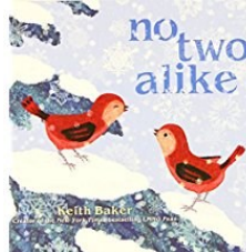
no two alike by Keith Baker