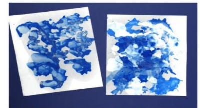
Rain & Wind Process Art