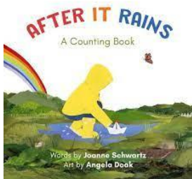
After it Rains