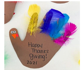
Trace a child's hand on brown paper & let them glue on feathers.