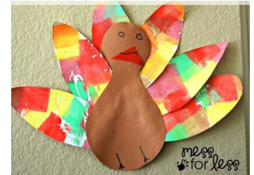
Let the children glue on tissue paper squares to color the tail feathers.

Alguna vez viste una Lassie? [Did you ever see a Lassie?]