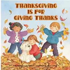
Por Margaret Sutherland